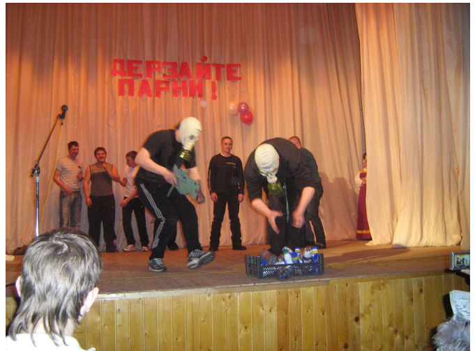
Участники конкурса «Дерзайте, парни!»

Хочется сказать большое спасибо всем организациям, которые активно сотрудничают с ДК: коллективу Нововилговской средней школы, д/о «Светлячок», Институту повышения квалификации с/х кадров, администрации поселения.