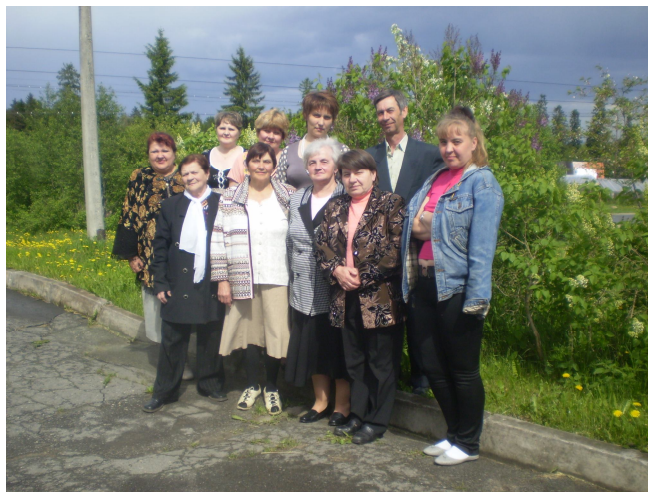
Коллектив Нововилговского Дома культуры